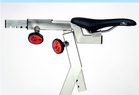
› Aquarider® Bambini Sattel *