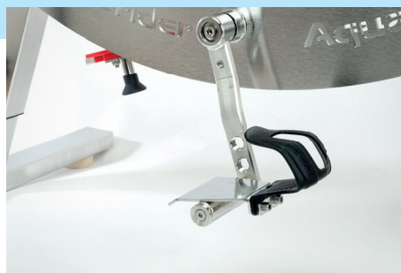
› Riemenlose Pedalkörbe mit Therapiekurbel